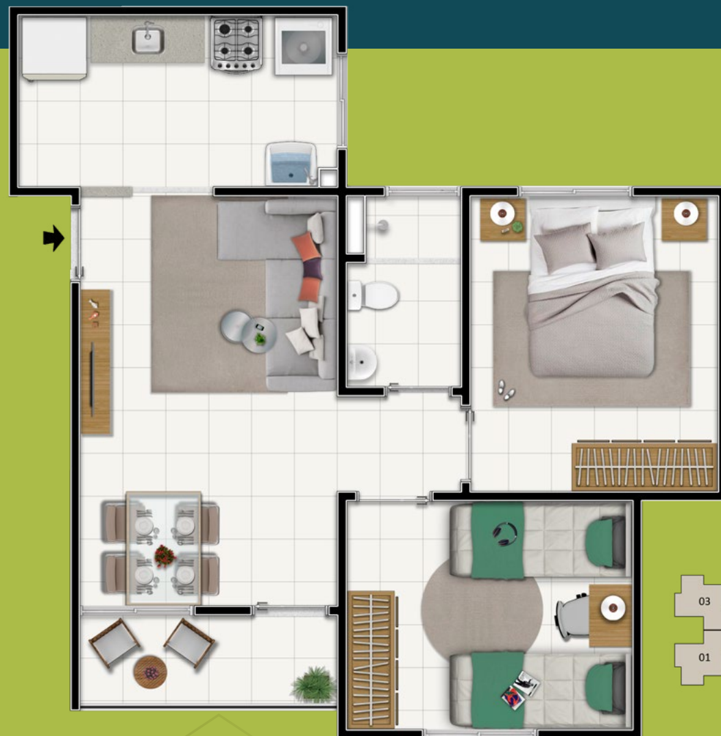
APTO TIPO 2º PAVIMENTO BLOCOS 01 E 04 A 31 FINAL 02