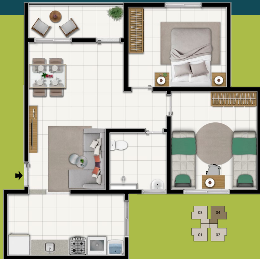
APTO TIPO 2º PAVIMENTO BLOCOS 02 E 03 FINAL 04