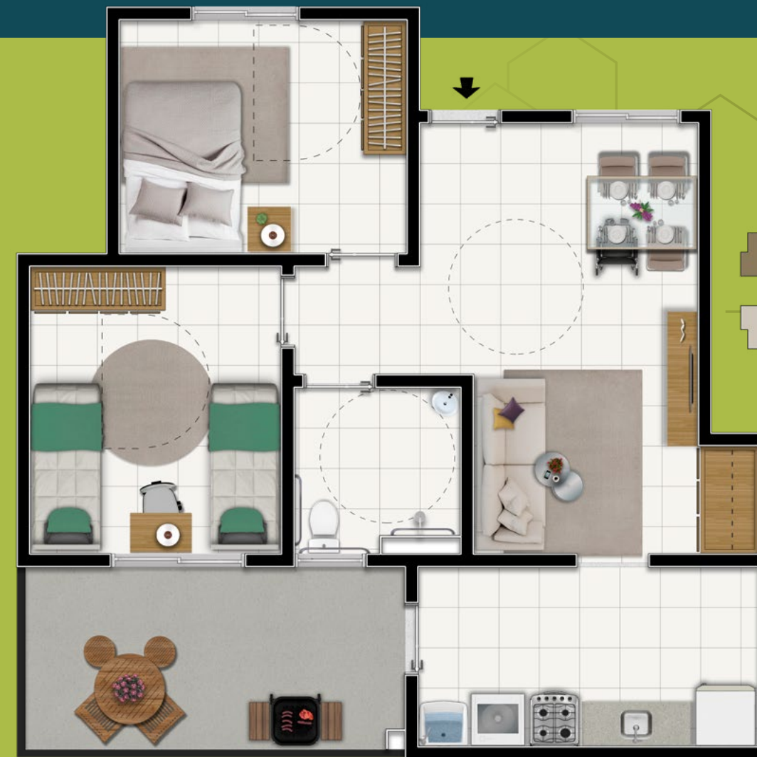
APTO TÉRREO PCD BLOCOS 02 E 03 FINAL 03