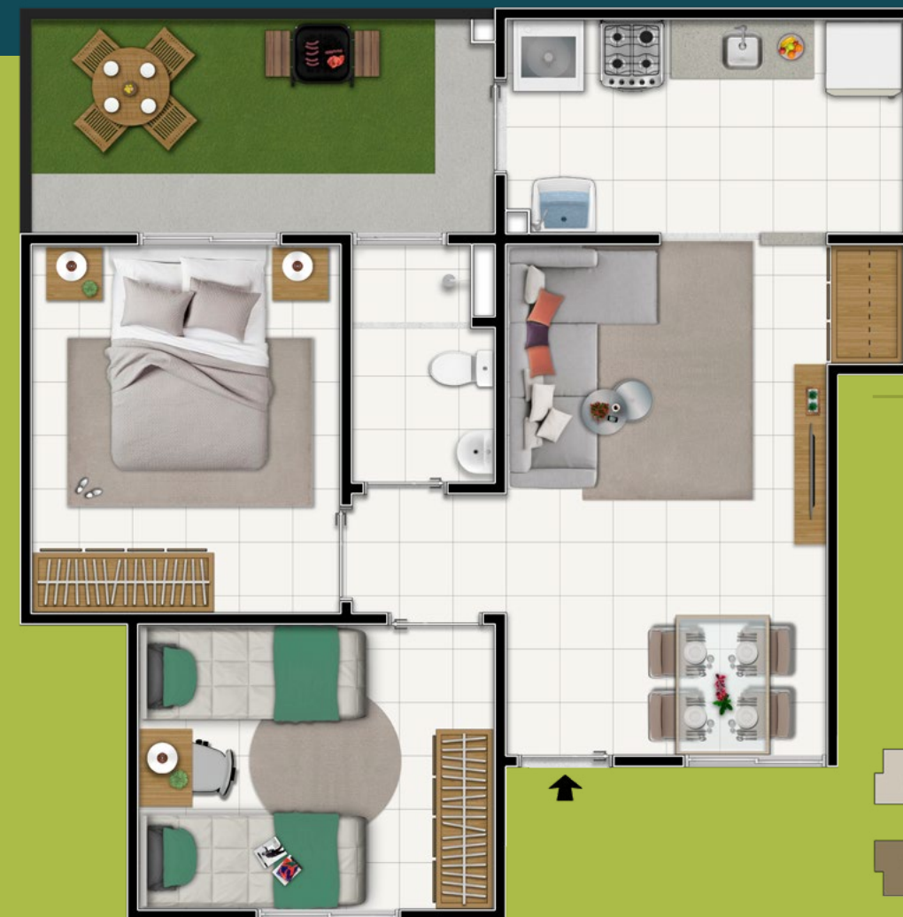
APTO TÉRREO BLOCOS 01 E 04 A 31 FINAL 01